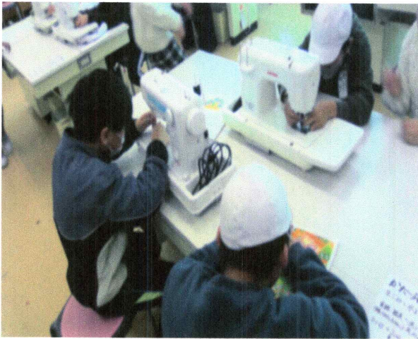
家庭科ミシン学習(5年)