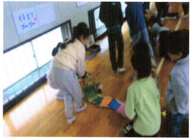
おもちゃフェスティバル(1年、2年)